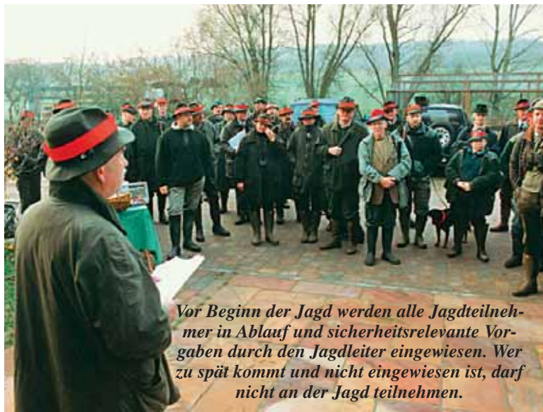
Vor Beginn der Jagd werden alle Jagdteilnehmer in Ablauf und sicherheitsrelevante Vorgaben durch den Jagdleiter eingewiesen. Wer zu spät kommt und nicht eingewiesen ist, darf nicht an der Jagd teilnehmen.

Da das Hutband auf weite Entfernung nicht erkennbar ist, tragen alle Treiber und alle Jäger zur besseren Wahrnehmung eine signalfarbene Jacke oder Weste.