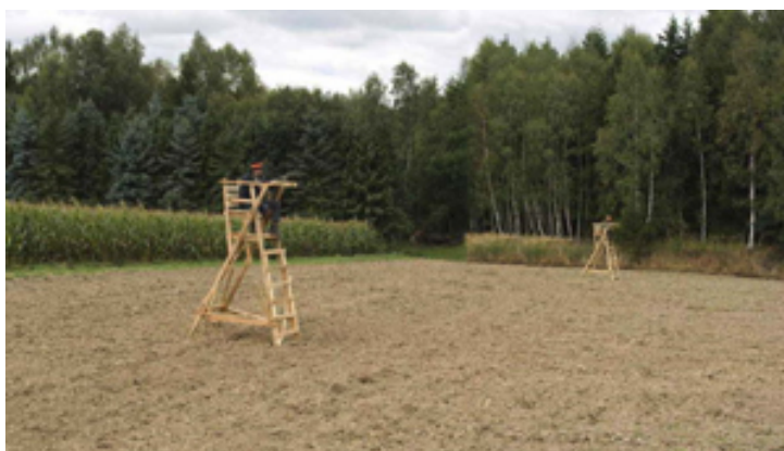
Wenn durch die Geländeform ein Kugelfang vorhanden ist, können niedrigere Ansitzeinrichtungen eingesetzt werden, auch z. B. landwirtschaftliche Anhänger.