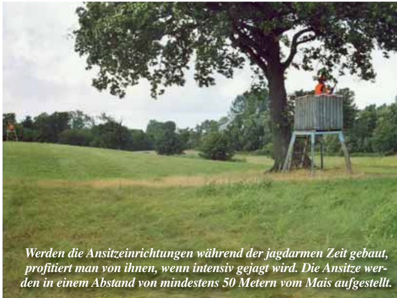
Werden die Ansitzeinrichtungen während der jagdarmen Zeit gebaut, profitiert man von ihnen, wenn intensiv gejagt wird. Die Ansitze werden in einem Abstand von mindestens 50 Metern vom Mais aufgestellt.