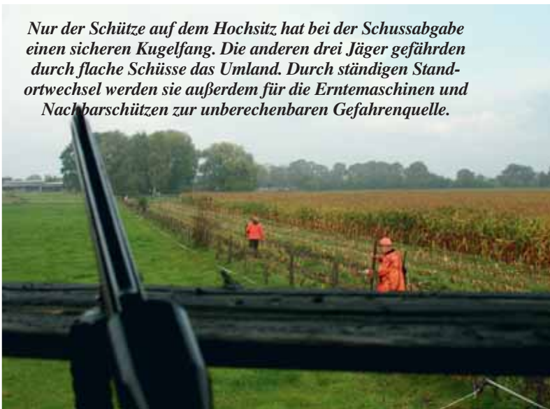
Nur der Schütze auf dem Hochsitz hat bei der Schussabgabe einen sicheren Kugelfang. Die anderen drei Jäger gefährden durch flache Schüsse das Umland. Durch ständigen Standortwechsel werden sie außerdem für die Erntemaschinen und Nachbarschützen zur unberechenbaren Gefahrenquelle.